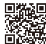
福岡県立高校ナビ